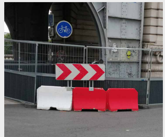
Petit modèle 1 m avec étrier + panneaux. Sécurisation renforcée sur des carrefours routiers.