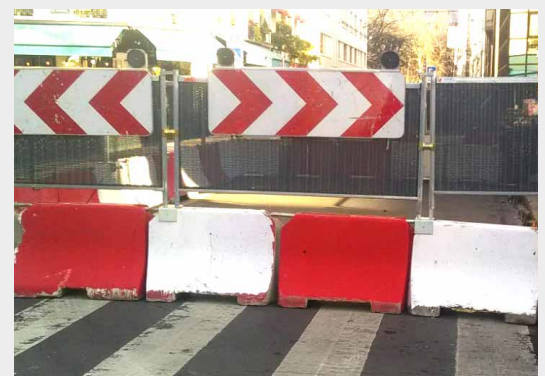
Avec réhausses Ville de Paris.