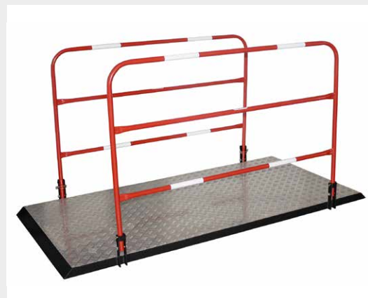
MANUTENTION 2 personnes requises.