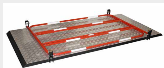
PATTE D'ACCROCHE DES GARDE-CORPS INTÉGRÉS