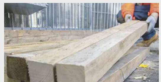
Chevrans pour bardage